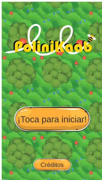
Figura 3. Pantalla de inicio de PoliniKaab.

La aplicación cuenta con una pantalla principal. Esta pantalla principal cuenta con dos botones; un botón para iniciar el juego, y otro botón para ver los créditos de la aplicación (Figura 3).