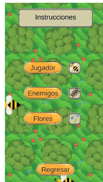
Figura 5. Menú de instrucciones

De igual forma, el menú principal permite el acceso de los usuarios al menú de instrucciones, en el cual se les presenta una guía rápida acerca del juego. Se presentan los diversos enemigos naturales y artificiales que la abeja puede enfrentar durante su vida, lo cual es el objetivo principal del video juego, y también las mecánicas para realizar el correcto manejo de la aplicación (Figura 5).