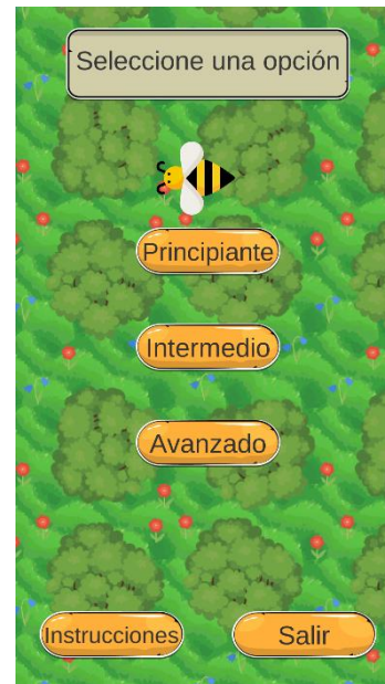
Figura 4. Menú principal de PoliniKaab.

diferente estructura, así como la aparición de diversos elementos (Figura 4).