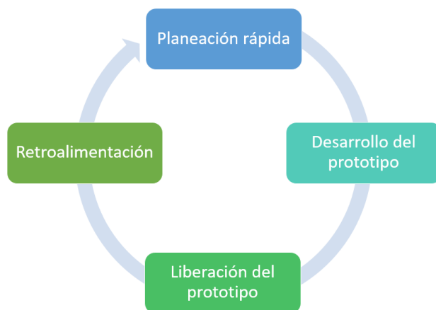
Figura 2. Ciclo de la metodología de desarrollo por prototipos utilizada.

Las herramientas seleccionadas para el desarrollo de la aplicación se determinaron por medio de una evaluación. Debido a que la aplicación comprende el método de enseñanza de m-learning , y que además usa la técnica de gamificación, se decidió que lo más conveniente sería desarrollar un video juego educativo enfocado a los dispositivos móviles (Smartphone, Tableta).