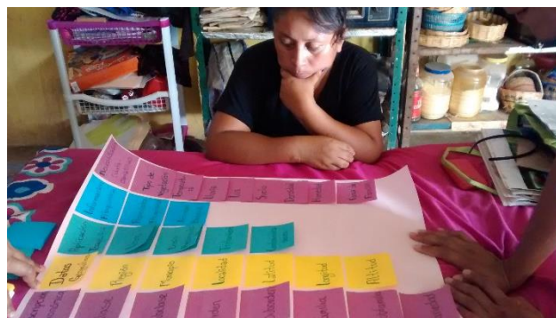
Figura 1. Aplicación del método de Card Sort a un usuario

Los usuarios clasificaron la información de las plantas en secciones, a las cuales asignaron un nombre general que identificara al grupo de características, algunos usuarios participaron en equipo y otros individualmente, tal es el caso del médico tradicional en su aplicación (Figura 1).